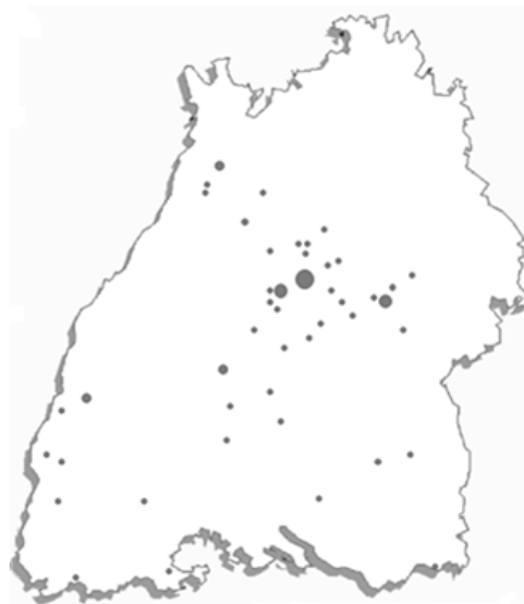
Abbildung 2: Streuung der Auftritte 2011

Für die überregionale Öffentlichkeitsarbeit ist eine angemessene landesweite Streuung der Auftrittsorte notwendig.